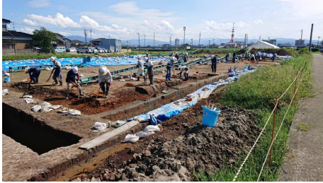
南新保遺跡群発掘調査の様子